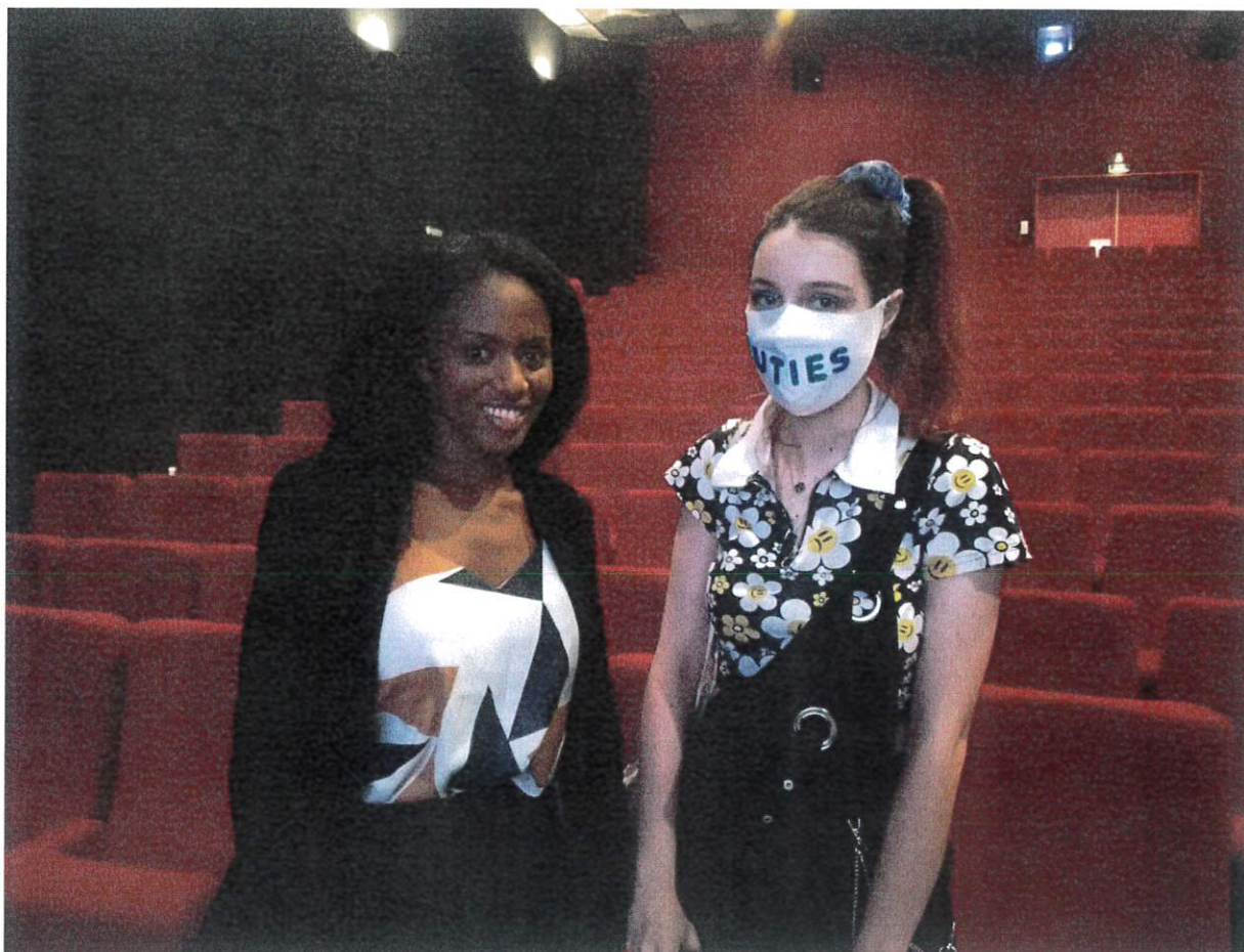
La réalisatrice Maïmouna Doucouré venue présenter son film Mignonnes et Laé, ambassadrice Cameo